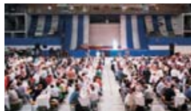
Da freut sich der Caterer: Jubiläumsevent 60 Jahre Hockeyclub Ambri-Piotta

Lentini Services SA, 6501 Bellinzona Tel. 091 825 89 46, www.lentini.ch