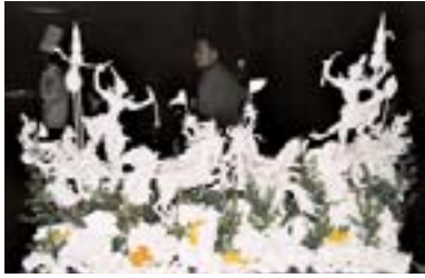
Da staunt der Küchenchef: was in Asien im Bereich Gemüseschnitzen realisiert wird, grenzt ans Unglaubliche