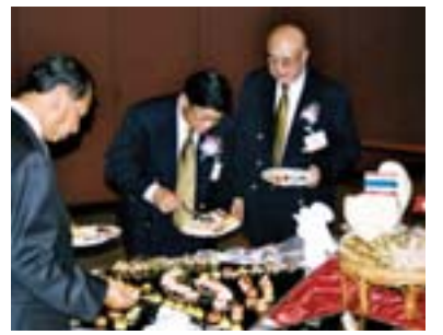
Guten Appetit: Premierminister Pitak Intaravittayanant und Tourismusminister Juthamas Siriwan in Aktion